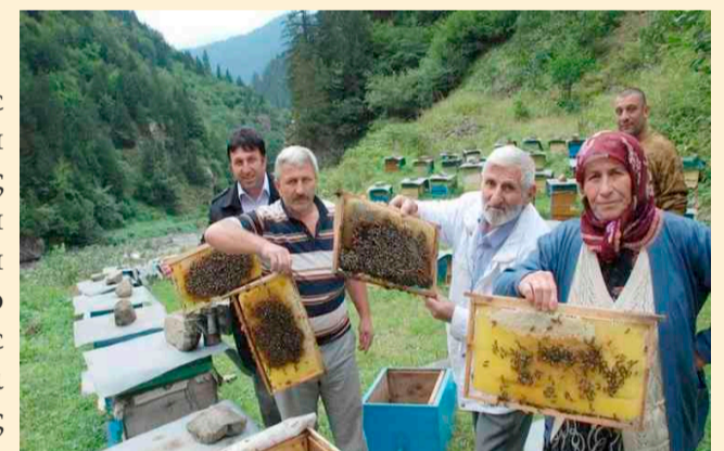
Φωτογραφία από Σαντά Πόντου

Έτσι έσβησε η καλή αρχή της συστηματικής μελισσοκομίας στην Σάντα, η οποία προϋπήρχε μεν αλλά ήταν πρωτόγονη και ερασιτεχνική.