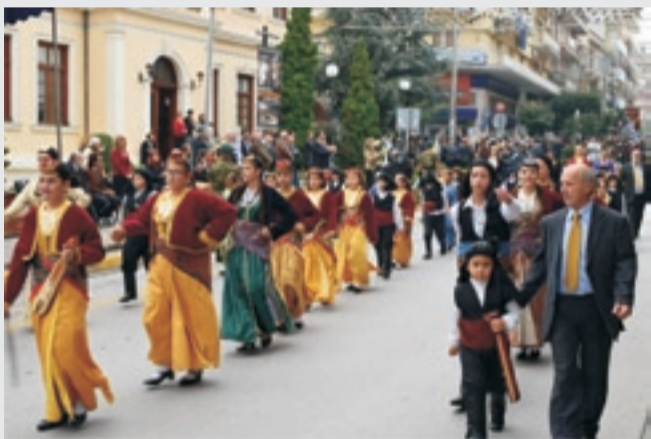
Τμήματα της ΕΛΒ παρελαύνουν υπερήφανα μπροστά από τους επισήμους στις 16 και 28 Οκτωβρίου.