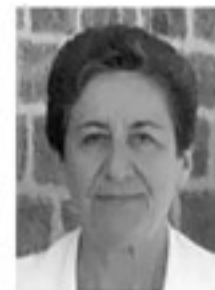
Ἐπιμέλεια: Ἰωσηφίδου Κωνσταντία

Σάββα Ἰωαννίδου: Μῦθοι καὶ ἄσματα Τραπεζοῦντος (τόμ. 16, σελ. 76)