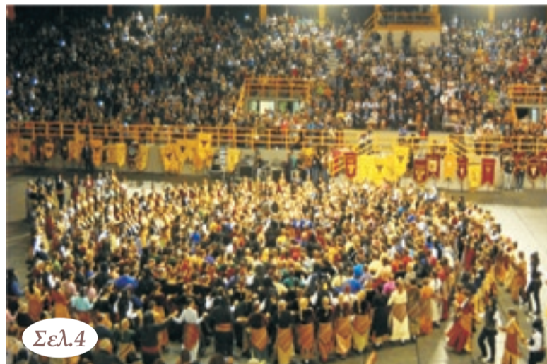
Από το 12ο Πανελ. Φεστιβάλ Ποντ.Χορών στην Ξάνθη (08/10/16)