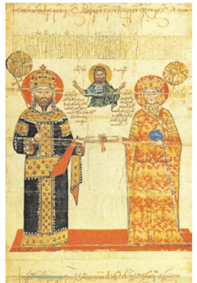
Ο Αυτοκράτορας Αλέξιος Γ΄ Μεγαλοκομνηνός με τη σύζυγό του Θεοδώρα Καντακουζηνή σε χρυσόβουλο της Μονής Γρηγορίου του Αγ. Όρους,

Έτσι ήρθε το τραγικό τέλος σε μια μεγάλη περίοδο ελληνικής κυριαρχίας, πολιτικής και πολιτιστικής στην καθ' ημάς Ανατολή.