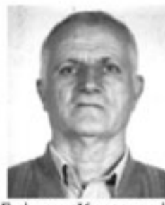
Γράφει ο Κωνσταντίνος Τσουμπούλιδης

ἑσὸ Σταυρὶν ἑσὸ χωρία ἀφκά ἑσὸ ποδάρια τοῦ ὄρους Θήχης ἐζήνεν ὁ Κυριάκον, μέρ' εἶξεν πέντε παιδία, τέσσερα ἀρνόπα καὶ τὸν Στάθιον. Ὅλα τὰ παιδία ἔτανε πολλά προκομμένα καὶ καλόβολα, ἀρ' ἀτὸς ὁ Στάθιον ἔτον ἕναν ξαῖ αἰθινος. Ὁ Κυριάκον εἶξεν χτήνη καὶ πρό'ατα. Κάθαν ἡμέραν ἔλμεγεν καὶ ἐφέρνεν τὸ γάλα ἑσὸ ὄσιπ'. Ἡ μάνναν ἄτ', ἡ Ἀννίτσα, ἐποίναν ἑξυγάλα καὶ κάθαν ἡμέραν ἐμάζερε ἀπὸ ἑσὸ καῖμάκ' γιὰ νὰ φτάη βοῦτουρον. Ὁ Στάθιον ὄθεν καὶ νὰ ἐκροφτεν ἡ μάνναν ἄτ' ἡ Ἀννίτσα τὸ ἑξυγάλαν ἀράεσε ἐβρικεν καὶ ἐτρῶε τὸ καῖμάκ'. Ἐποσαλεύτεν ἡ Ἀννίτσα καὶ ἕναν ἡμέραν ἐθέκεν ἀπέσ' ἑσὸ μέσ' ἑσὸ δῶμα τὸ σκεῦος μὲ τὸ ἑξυγάλα καὶ ἐκοῦμπ'σεν ἀπάν' ἕναν καρσάν'. Ὁ Στάθιον ἔρθεν καὶ ἐποίκεν τ' ὄσιπ' ἀπάν' ἀφκά, ἄλλα καὶ ἐπόρεσε νὰ εὐρίκει αὐτὸ. Ὅντες ἐκλώστεν ἡ Ἀννίτσα ἑσὸ ὄσιπ' ἐρωτᾷ ὁ Στάθιον: «Μάννα ὄσημερον καὶ ἐποίκες ἑξυγάλα!» «Κι ἀτέ ἀπαντὰ: Πῶς καὶ ἐποίηκα» Καὶ ὁ Στάθιον ἐρωτᾷ: «Μέρ' ἐν, βρέ μάννα, τὸ ἑξυγάλαν» καὶ αὐτὸτε ἡ μάνναν ἄτ' ἀπαντὰ: «Ἐποίηκα, πῶς καὶ ἐποίηκα, ἀτουχὰ ἀπέσ' ἑσὸ μέσ' ἑσὴν κάμαριν, ἐμπροστὰ σ' ἐν». «Ἄχ μάννα, πῶς καὶ ἐπόρεσα νὰ εὐρίκ' αὐτὸ καὶ ἀτῶρα ἐκλώστες καὶ ἐσὸ ἄ σὸ δουλείας» καὶ ἀπά καὶ ἀπαν' ὄλε τὴν ἡμέραν ἐκλεεν πῶς καὶ ἐπόρεσε νὰ τρώη τῆ ἑξυγαλί τ' ἀπάν'.