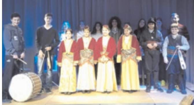
Τα κάλαντα στην Βιβλιοθήκη Βέροιας.

Ανταποκρινόμενοι στο ευγενικό κάλεσμα της Δημόσιας Κεντρικής Βιβλιοθήκης Βέροιας, τα παιδιά της Ε.Λ.Β. έψαλλαν την Τρίτη 27 Δεκεμβρίου 2016 τα παραδοσιακά ποντιακά κάλαντα, στον χώρο της Βιβλιοθήκης.