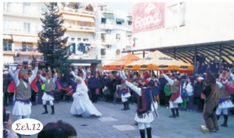
Οι Μωμόγεροι μπροστά στο Δημαρχείο