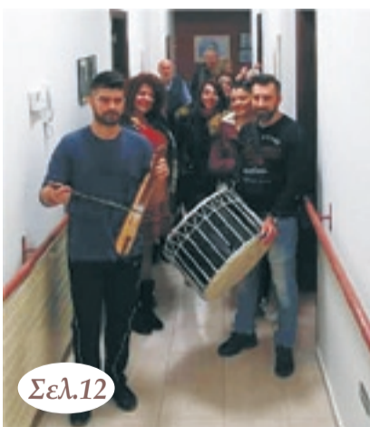
Η ΕΛΒ στο γηροκομείο Βεροίας