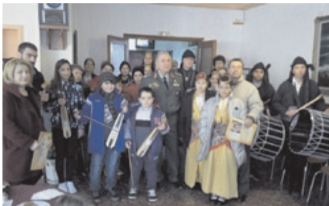
Τα κάλαντα στον Διοικητή της 1ης Μεραρχίας στην Λέσχη Αξιωματικών Βέροιας.