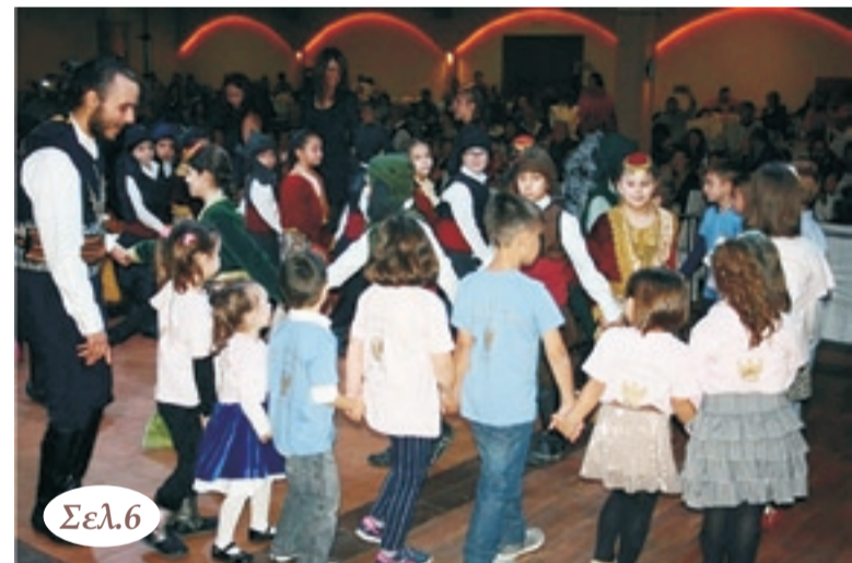
Από τον ετήσιο χορό της ΕΛΒ στις 26/11/16