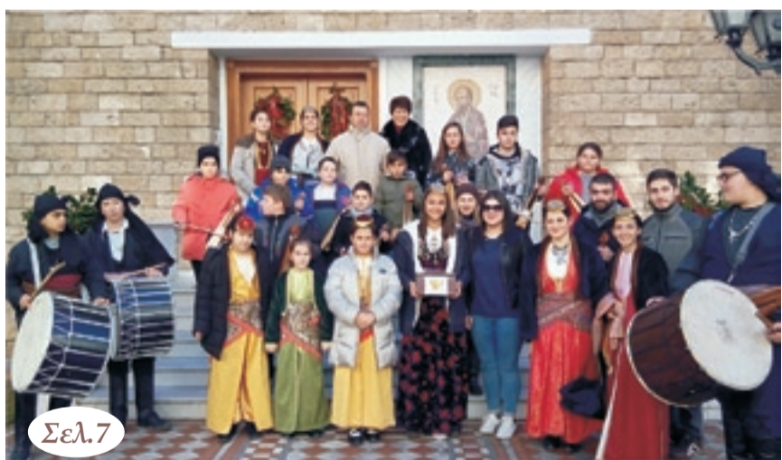
Οι νέοι της ΕΛΒ φάλλουν τα κάλαντα στην πόλη