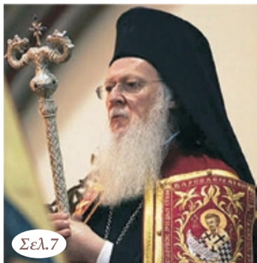
"Χριστού δ' ενανθρώπησις, ἄλλη μοι πλάσις"

ΠΡΟΣ ΤΑ ΜΕΛΗ ΤΗΣ Ε.Λ.Β. ΠΡΟΣΚΛΗΣΗ ΣΕ ΓΕΝΙΚΗ ΣΥΝΕΛΕΥΣΗ ΚΑΙ ΕΚΛΟΓΕΣ Καλούνται τα μέλη της Ευξεινού Λέσχης Βεροίας σε Τακτική Γενική Συνέλευση που θα γίνει στο Πνευματικό Κέντρο της Λέσχης (Λ.Πορφύρα 1, Βέροια), την Κυριακή 15 Ιανουαρίου 2017 στις 11.00 π.μ. με πρόγραμμα : 11.00 - 11.15: Αγιασμός και κοπή βασιλόπιτας 11.15 - 11.30: Βράβευση των αριστούχων μαθητών και των σπουδαστών στην τριτοβάθμια εκπαίδευση παιδιών της Λέσχης... 14.00-18.00: Ορισμός Εφορευτ. Επιτροπής και Εκλογές για ανάδειξη νέου Διοικητικού Συμβουλίου και Ελεγκτικής Επιτροπής... Δικαίωμα συμμετοχής στις εργασίες της Γ.Σ. έχουν τα μέλη που είναι τακτοποιημένα οικονομικά. Η παρουσία στη Γ.Σ. και η τακτοποίηση των συνδρομών σας κρίνεται απαραίτητη καθώς και η έγκαιρη υποβολή υποψηφιοτήτων στα όργανα της Λέσχης... Από το Διοικητικό Συμβούλιο (περισσότερα στη σελίδα 2)