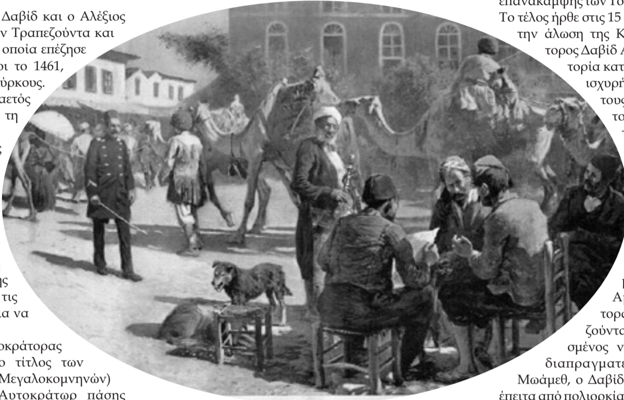
Edwin L. Weeks: Εγχάρακτο που απεικονίζει την πλατεία της Τραπεζούντας (Μεϊντάνι) του 1896

Η ζηλευτή στρατηγική θέση της Τραπεζούντας, που της εξασφάλιζε άνετη πρόσβαση στη νότια Ρωσία, στα βάθη της Ασίας αλλά και στη Δύση, την ανέδειξε σε αδιαμφισβήτητο κέντρο του εξαγωγικού και διαμετακομιστικού εμπορίου. Μέχρι το 12 ο αιώνα έκανε εξαγωγές στην ευρύτερη περιοχή του Πόντου αρώματα και φαρμακευτικά είδη, βαφές, υφάσματα, ξυλεία, κρασί,