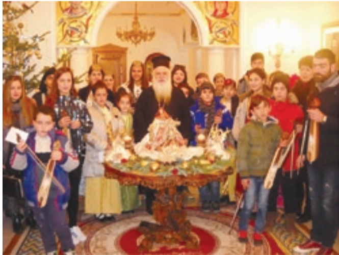
Τα παιδιά της ΕΛΒ ψάλλουν τα κάλαντα στον Μητροπολίτη Βέροιας Ναούσης και Καμπανίας κ. κ. Παντελεήμονα.

Την παραμονή των Χριστουγέννων τα μέλη των τμημάτων της Λέσχης έψαλαν τα παραδοσιακά ποντιακά κάλαντα στον Διοικητή της 1ης Μεραρχίας στην Λέσχη Αξιωματικών, στον Μητροπολίτη Βέροιας Ναούσης και Καμπανίας κ.κ. Παντελεήμονα, στον Δήμαρχο Βέροιας κ. Κ. Βοργιαζίδη και στα καταστήματα της πόλης και ευχήθηκαν: «Υείαν, Ευλοϊαν και Καληχρονίαν».